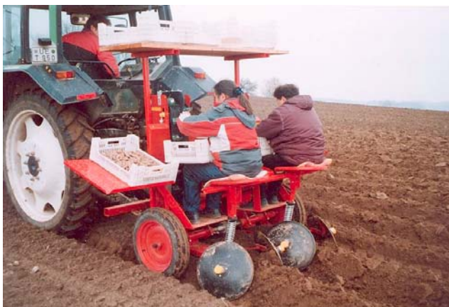
Manuelles Einlegen (Versuchstechnik)

Auf dem Leitbetrieb Stautenhof in Willich-Anrath (Höhe ü. NN 45 m, Temperatur 9,3 °C, Niederschlag 700 mm, Bodenart sL, 60-80 Bodenpunkte) sowie auf dem Versuchsbetrieb Wiesengut der Universität Bonn in Hennef/Sieg (Höhe ü. NN 65 m, Temperatur 10,3 °C, Niederschlag 840 mm, Bodenart sL-uL, 60 Bodenpunkte) wurde in einem zweifaktoriellen Großparzellenversuch mit vier Wiederholungen die Keimverlustrate von jeweils vier Kartoffelsorten (Stautenhof: Belana , Nicola , Solara und Salome sowie auf dem Wiesengut: Belana , Nicola , Karlana und Marabel ) nach Pflanzung mit einem üblicherweise in Versuchen genutzten Halbautomat mit Drehteller und Handeinlage (abweichend im Bild unten dargestellt: manuelles Einlegen in eine Becherpflanzmaschine) im Vergleich zu einer praxisüblichen Becherpflanzmaschine mit Rollboden ermittelt. Dafür wurden die Keime aller Knollen vor und nach der Pflanzung (Stautenhof: 19. April, Wiesengut: 15. April) gezählt. Um dies zu ermöglichen wurden die Furchen erst nach der Ermittlung der Keimverluste in einem weiteren Arbeitsgang zugehäufelt. Weiterhin wurde die Wirkung der unterschiedlichen Pflanzmaschinen auf die Pflanzenentwicklung (Feldaufgang, Stängel je Quadratmeter) sowie den Knollenertrag und die Ertragskomponenten ermittelt.