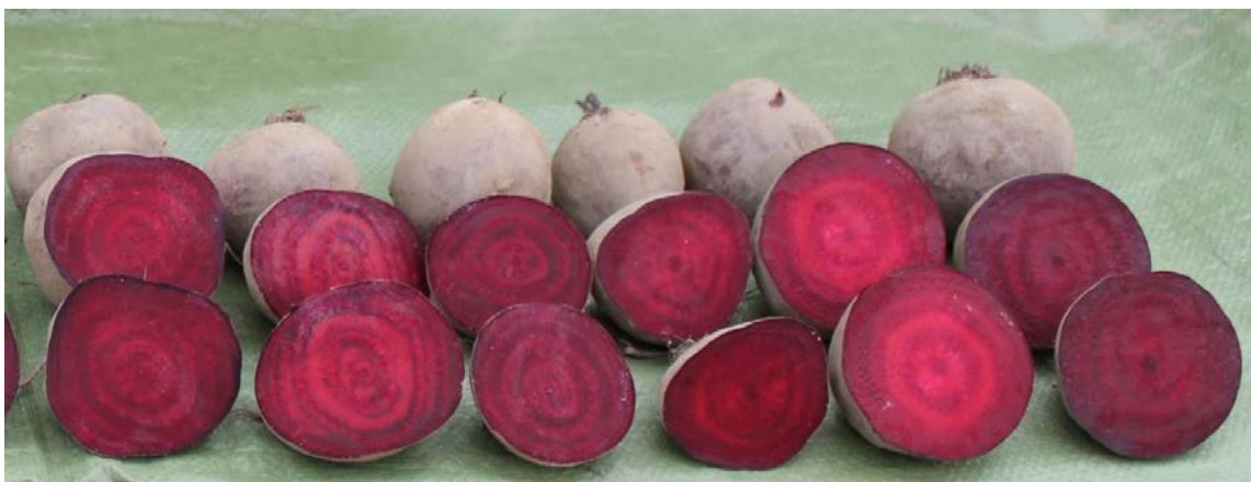
Jannis, Red Atlas, Red Titan, Akela, Betty, Monty

Abb. 4: Je eine aufgeschnittene und eine ganze Rübe einer Sorte. Links beginnend.