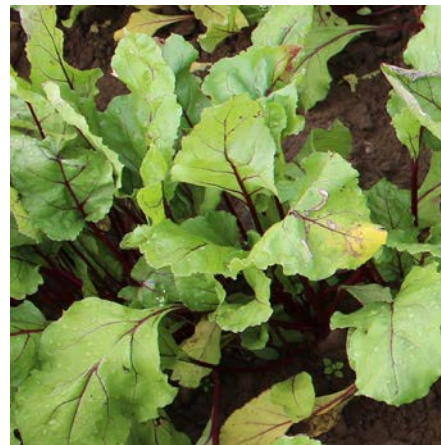
Robuschka, geringer Cercospora-Befall