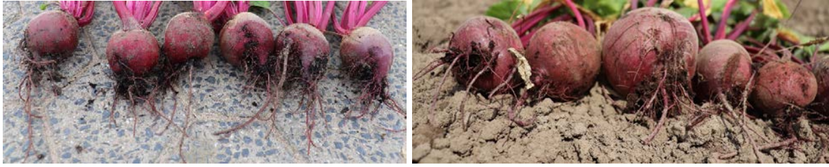
Abb. 1 Stark verzweigte Wurzeln (links 2021, rechts 2020).