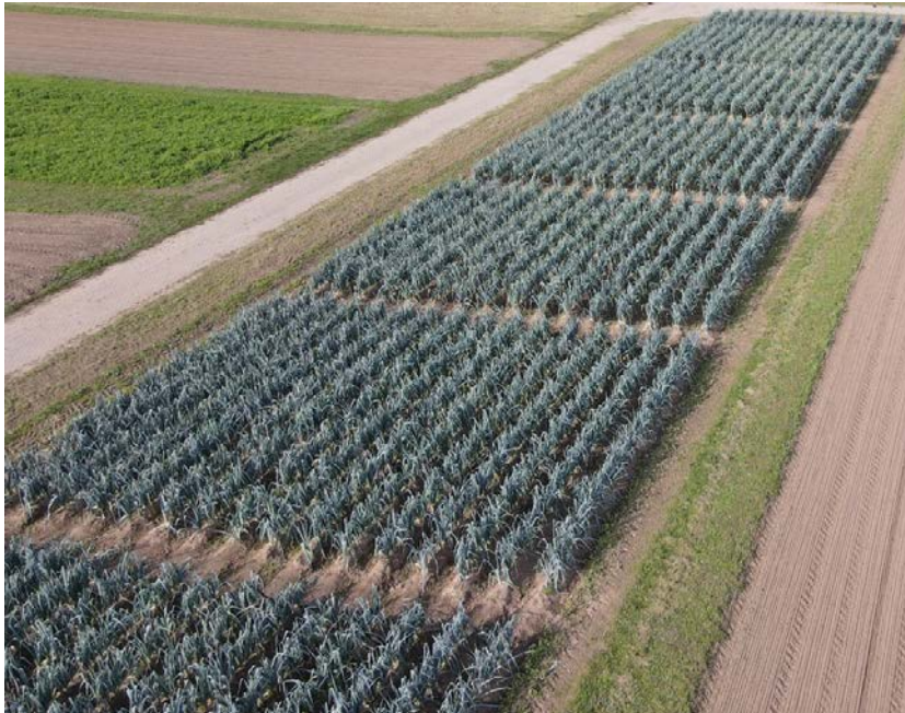
Abb. 3 Handelsdünger-Versuch von oben am 12.Oktober 2022. Ungedüngte und mit Luzernepellets gedüngte Parzellen haben ein helleres Blattgrün.